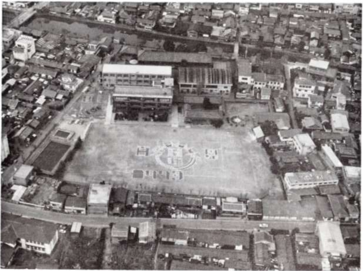
▲百年をむかえた日方小学校（昭和48年2月1日）